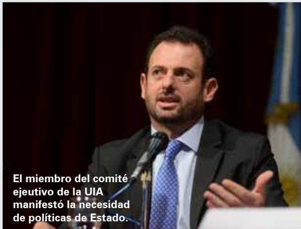
El miembro del comité ejecutivo de la UIA manifestó la necesidad de políticas de Estado.