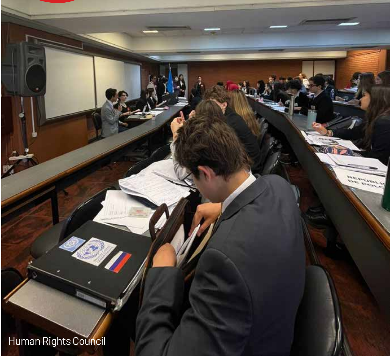
Human Rights Council