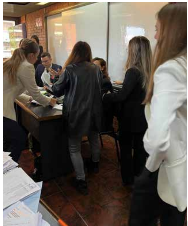
Prensa informando a la Presidencia acerca de los ataques

La Federación Rusa realizó ataques aéreos a Bangladesh para conquistar sus territorios y quitarle poder a China. Además, comenzó a atacar y tomar posición en el territorio de Mozambique con la finalidad de influenciar la zona africana y oponerse a la influencia europea. Si bien el conflicto es reciente, los países están debatiendo sobre qué hacer al respecto para afrontar esta situación de la mejor manera posible.