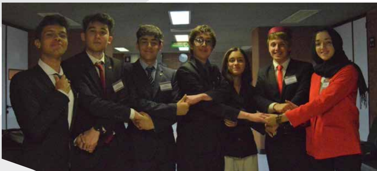
Delegación de Los Estados Unidos, Túnez, Vietnam y San Vicente y las Granadinas.

A pesar de la interpelación de Rusia que reclamó por la legalidad de las sanciones económicas, los representantes de San Vicente y Las Granadinas lograron consensuar en el respeto a las recomendaciones emanadas por el Consejo de Seguridad y la adhesión unánime de los países reunidos en la Asamblea. Fue un momento histórico ver a los tres delegados de Rusia, Vietnam y Estados Unidos en el estrado informando en forma conjunta a la Asamblea sobre las adiciones al proyecto y la importancia del mismo. El reconocimiento va para la actuación impecable de San Vicente y Las Granadinas quienes junto a Túnez aportaron los instrumentos que permitieron la aceptación unánime donde todas las partes quedaron satisfechas.