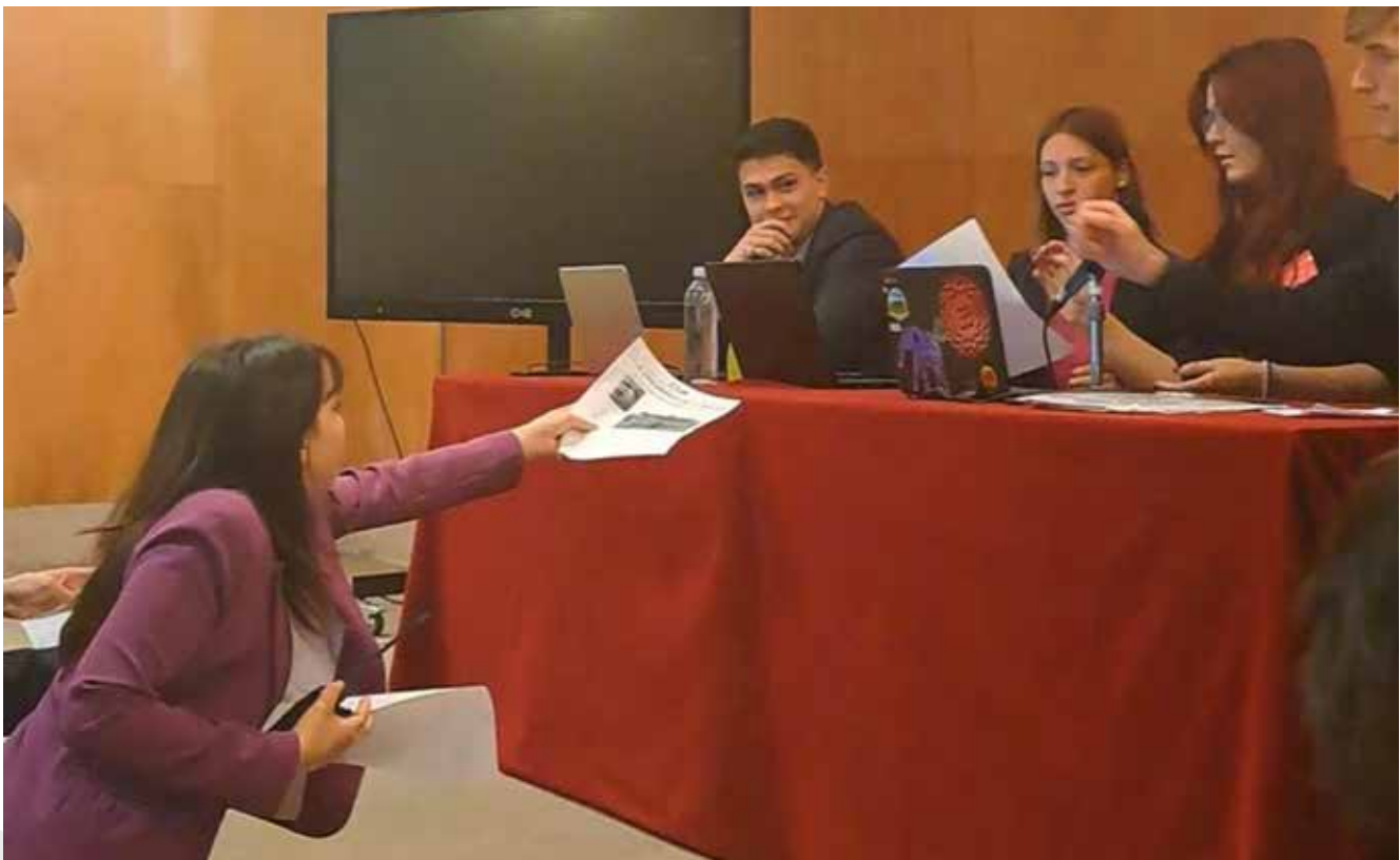
La directora de la prensa entregando a presidencia la noticia

Todos los discursos están dirigidos a la delegación de Estados Unidos, incluso desde sus aliados, como la Quinta República Francesa que accedió a implementar las severas sanciones económicas que sugirió la Federación Rusa. Luego de un periodo muy enérgico de intercambios entre delegaciones, cesaron las aguas y comenzaron a buscar soluciones al problema, siempre priorizando la paz. La mismísima Rusia aceptó "el alto al fuego" y el diálogo sugerido por Estados Unidos. Este es un claro ejemplo de que ni siquiera las grandes potencias están a salvo de la desinformación o la información errónea, algo que resulta muy preocupante porque son vidas las que están en juego y se debería tener más cuidado cuando se acusa de cosas tan severas.